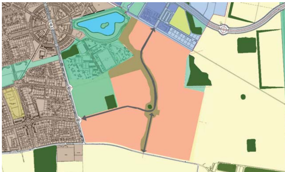
Proposition d'axes structurants de l'EPA

« Les voitures dans le futur seront électriques. Est-ce que des bornes de recharge pour voitures électriques seront prévues ? »