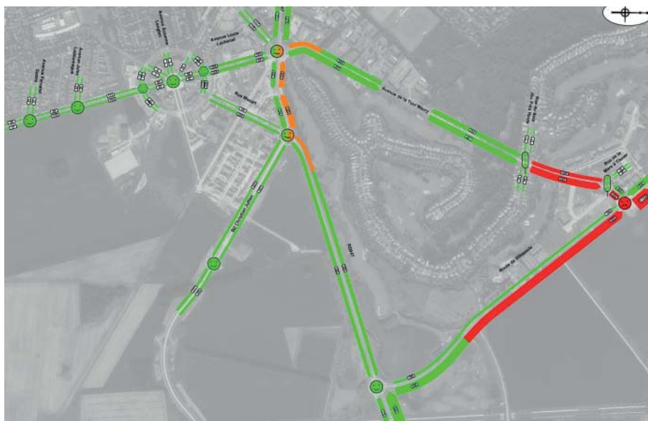
Diagnostic de l'état actuel à l'heure de pointe du matin (ACC-S)

L'étude des projections du trafic liées à la réalisation de la ZAC de Villeray est en cours de réalisation et ses résultats seront intégrés à l'étude d'impact au premier semestre 2017.